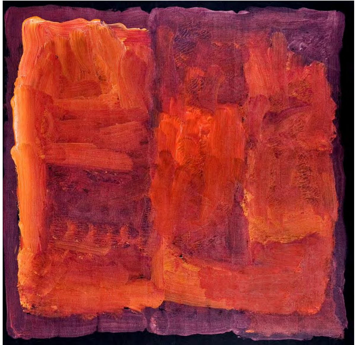
Kudjitji Kngwarreye Mein Land, Acryl auf Leinen, 2010

Dr. Jürgen Doppelstein (+49) 4103 918291 (+49) 171 4779770 kontakt@ernst-barlach.de