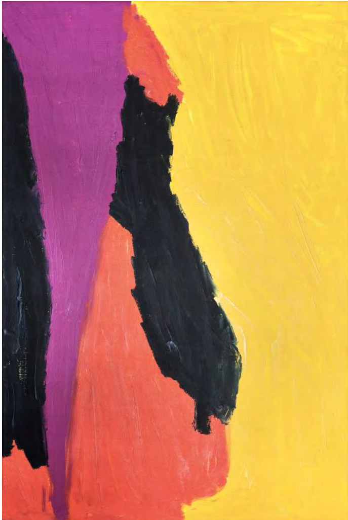
Mirdidingkingathi Juwarnda Sally Gabori Mein Land, Synthetischer Polymer auf Leinen, 2009