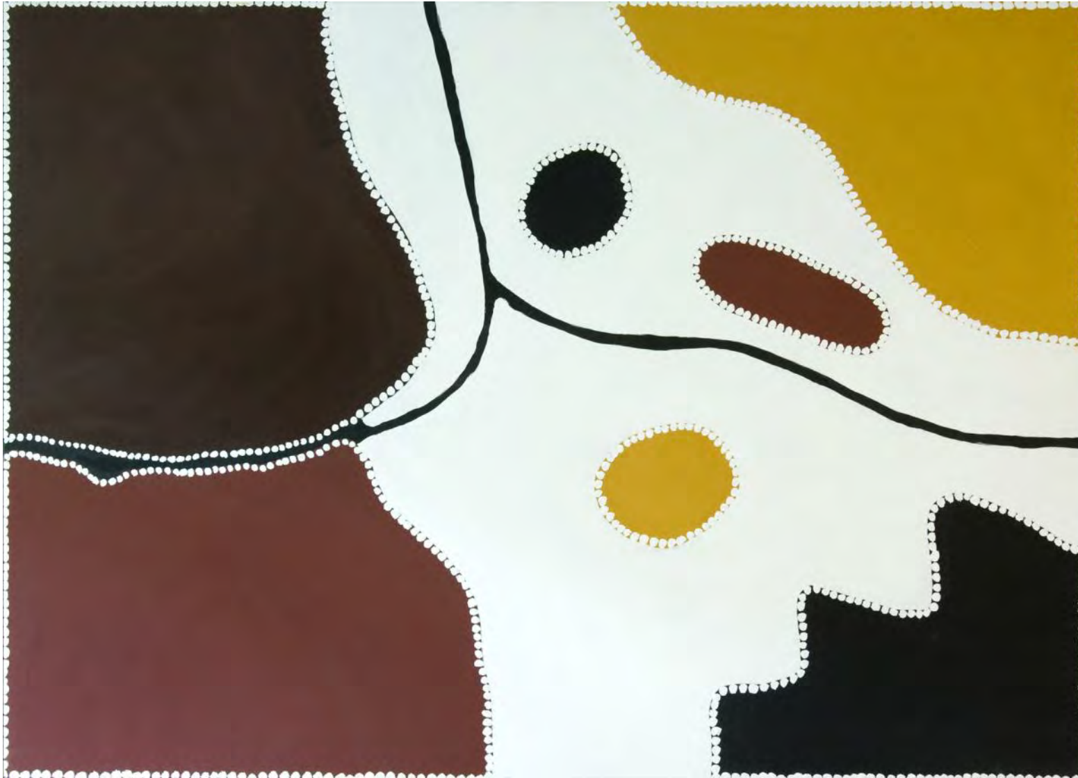
Freddie Timms Sallybutte Creek - Springvale, Ocker auf Leinwand, 1998