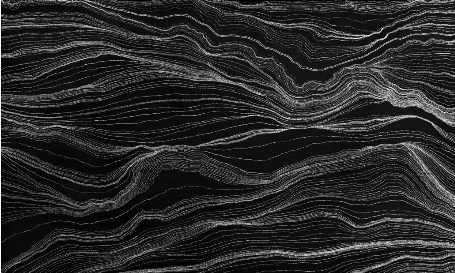
Anna Price Petyarre Sandhügel und Wasserlauf, Acryl auf Leinwand, 2008