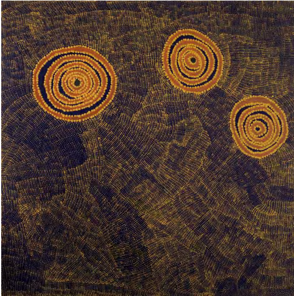
Wentja Napaltjarri Felslöcher westlich von Kintore, Acryl auf Leinen, 2009

Coverbild: Minnie Pwerle Awelye, Acryl auf Leinen, 2004