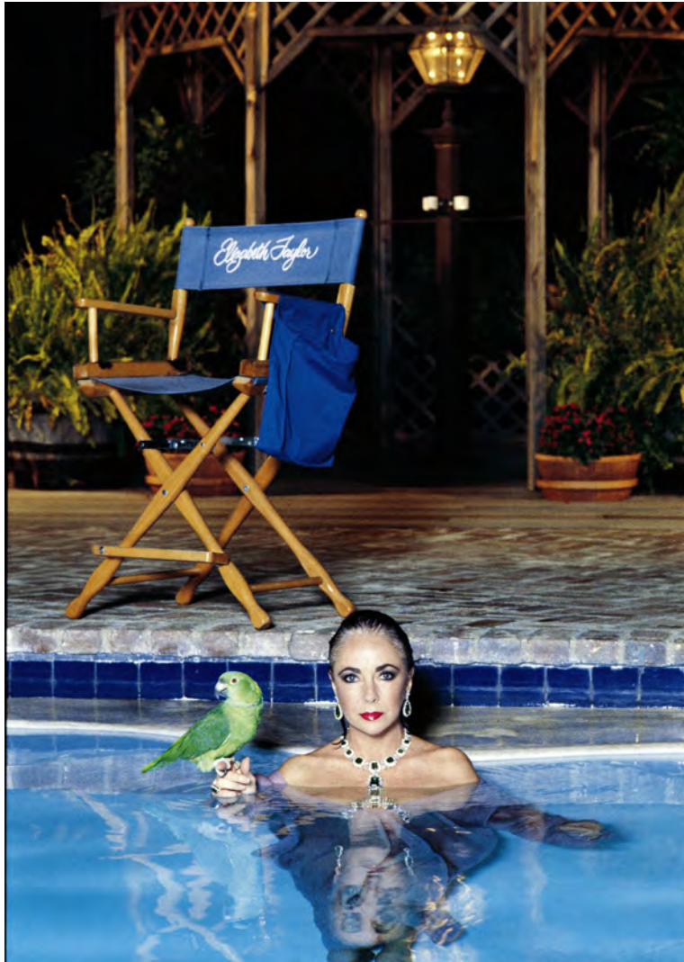
Helmut Newton (1989) Elizabeth Taylor - Vanity Fair, Los Angeles

Im April 2000 erregte Newtons sogenannter SUMO-Bildband großes Aufsehen, als das Exemplar Nummer eins den Rekord für das größte, schwerste und teuerste Buch des 20. Jahrhunderts brach.